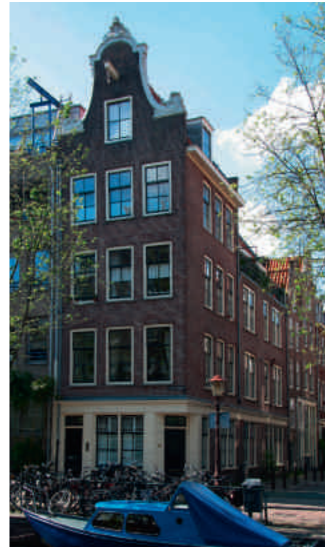
Afb. 1. Lauriergracht 62, hoek Eerste Laurierdwarsstraat (1933)

De zeventiende-eeuwse Amsterdamse binnenstad is met haar achtduizend monumenten een beschermd stadsgezicht in de zin van de Monumentenwet en sinds 2010 is de grachtengordel