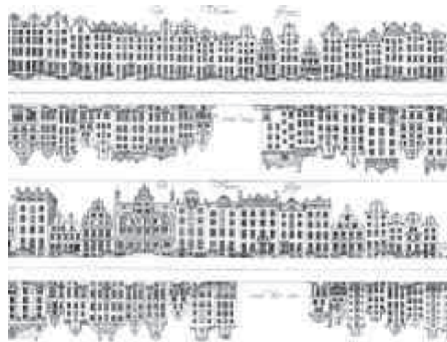
Afb. 11. Eén van de gegraveerde platen van het Grachtenboek van Caspar Philips, 1768-1771

gen van het belang van het in stand houden van de rijke variatie aan gebeeldhouwde gevelbeëindigingen die in het boek was vastgelegd, op een moment dat de vervanging van topgevels door rechte lijsten nog niet had plaatsgevonden.