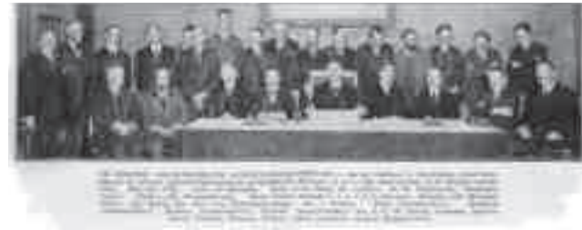
Afb. 9. Krantenknipsel, gedateerd 9 september 1924, in het archief van Van Houten (KOG archief). Door Van Houten uitgeknipt en van datum voorzien. Van Houten vond dit een 'handig' knipseltje omdat alle leden van de nieuwe Schoonheidscommissie met naam werden vermeld