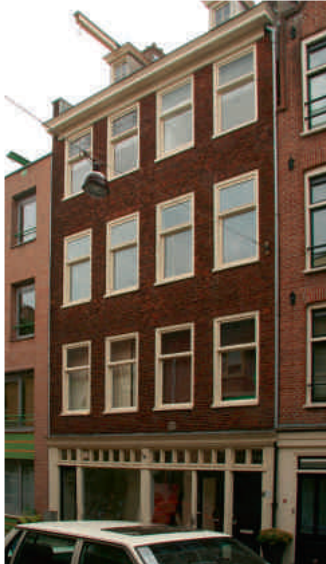
Afb. 6. Uitgevoerde nieuwbouw Laurierstraat 59-61 zonder hergebruikte oude toppen, maar met veel stilistische eigenschappen van Van Houtenpanden, die in feite de eigenschappen zijn van het jaren dertig-bouwen

dat hier sterk op lijkt, schreef Van Houten dat het is 'ingericht naar de thans geldende voorschriften, doch zonder eenige architectonische pretentie'. 18 Van dergelijke panden bestaan talrijke voorbeelden. In sommige gevallen worden ze gecombineerd met elementen als balkons en erkers die wezensvreemd zijn aan het karakter van de historische bebouwing van de binnenstad. 19 Van Houten had begrip voor het feit dat er niet altijd meer mogelijk was dan het herplaatsen van een geveltop, omdat de woningen ook in een moderne behoefte moesten voorzien. 20 Dit vereiste immers een bepaalde plattegrond en dus een corresponderende gevelindeling. Dit kwam niet altijd overeen met het door hem gewenste historische gevelbeeld. Bij een pand op de Reguliersgracht, waar een garage-ingang werd gemaakt, merkt Van Houten op dat twee moeilijk verenigbare zaken met elkaar in overeenstemming moesten worden gebracht: 'de omgeving niet storen en toch in moderne behoefte voorzien'. 21 Veel Van Houtenpanden zijn dus feitelijk jaren dertig-woningen met als enige verschil de hergebruikte geveltop. Dit beeld is echter niet wat Van Houten nastreefde. Hij probeerde ook belangrijke andere