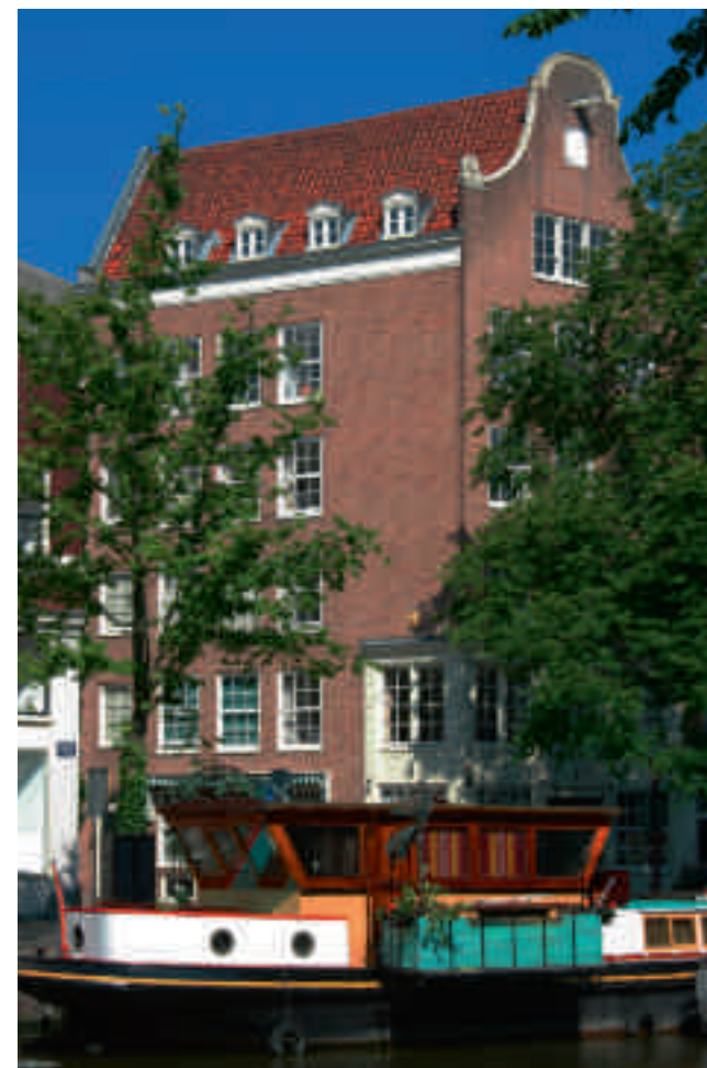
Afb. 12. Prinsengracht 274, hoek Elandsstraat (A.A. Kok, 1936)

Een inventarisatie op basis van een beperkt aantal stilistische kenmerken levert een geheel andere lijst van Van Houtenmonumenten op dan een opsomming van alle panden waarbij Van Houten aantoonbaar was betrokken. De door Van Houten opgestelde lijst bevat 127 geveltoppen, waarvan er in de periode 1928-1947 slechts 65 daadwerkelijk zijn gebruikt bij nieuwbouw of restauraties. Van Houten leverde niet alleen geveltoppen voor typische jaren dertig-nieuwbouw, maar ook voor projecten met een meer restauratieve benadering die overigens zijn voorkeur genoten. Tegelijkertijd betekent deze conclusie dat Van Houten in zijn werkwijze niet alleen stond. Het grote aantal Van Houtenpanden op de BMA-lijst zou anders niet te verklaren zijn. Het streven van Van Houten om oude gevelfragmenten te herplaatsen werd dus op grote schaal nagevolgd.