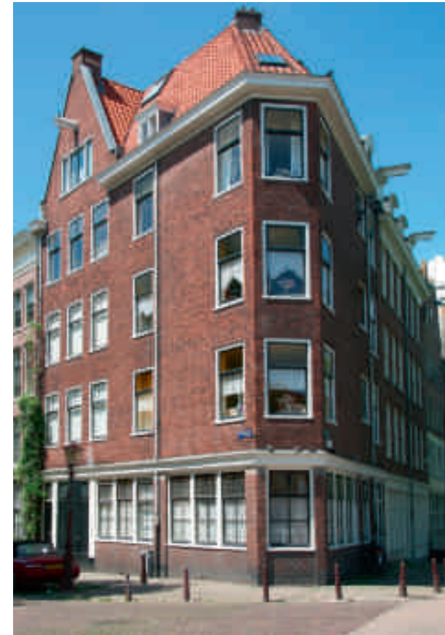
Afb. 3. Typerende nieuwbouw uit de jaren dertig. Palmgracht 2, hoek Brouwersgracht. In alle opzichten een Van Houtenpand, maar dan zonder herplaatste geveltop

merkt dat het geen kopie is van het oude. 14 Deze benadering maakt het mogelijk een groot aantal panden in de Amsterdamse binnenstad als Van Houtenmonumenten te identificeren, maar gaat voorbij aan de vraag of Van Houten daadwerkelijk bij de bouw betrokken was.