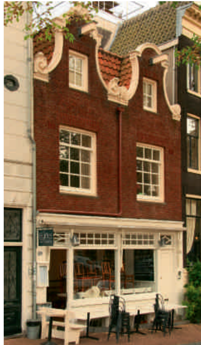
Afb. 2. Herengracht 309-311 (1935)