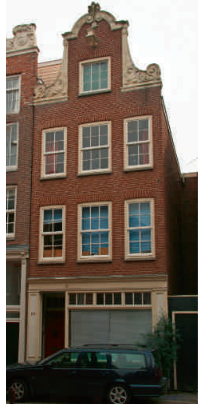
Afb. 8. Anjelijsstraat 23. Alleen aan de gelijke verdiepingshoogte en de vrij hoge borstweringen is te zien dat het een Van Houtenpand is

Aan het andere uiteinde van het spectrum bevinden zich Van Houtenmonumenten die vrijwel niet te onderscheiden zijn van oude gevels. Een goed voorbeeld hiervan is Anjelijsstraat 23 (afb. 7 en 8). Van Houten was hier zo tevreden over dat hij het pand expliciet noemt in Amsterdamsche Merkwaaardigheden , een enkele malen herdrukt boekje in de Heemschutreeks dat allerlei bijzonderheden van Amsterdamse woonhuizen beschrijft. Bij dit pand was een restauratieve benadering gekozen, waar de adviezen van de bouwinspecteur naar de letter waren opgevolgd, zelfs zodanig dat Van Houten als één van de architecten wordt genoemd. Het resultaat is naar zijn volle tevredenheid omdat 'het uiterlijk zoveel mogelijk met het oude stadskarakter in overeenstemming (is) gebracht', 22 door het gebruik van een dunne, rode handvormsteen, het op vlucht bouwen van de gevel, de verdeling van de kozijnen in overeenstemming met de hals, gelijkvormige ruiten met een goede verhouding en, een roedenverdeling. Op die manier werd de kritiek van architecten dat de gevel-