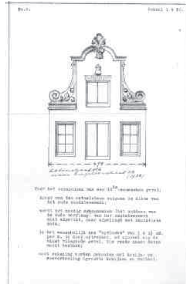
Afb. 7. Anjelijsstraat 23. Tekening top nr. 2, afkomstig van Kalverstraat 116, met voorschriften van Van Houten waaraan de herbouw van een gevel moest voldoen (Tekening Van Houten, KOG archief.)

eigenschappen van oude Amsterdamse gevels gerealiseerd te krijgen, zodat een pand er minder eigentijds uit zou zien en zich beter zou voegen in de omgeving. Hij lijkt zich bewust van de architectenkritiek dat een geveltop moet passen op de gevel, meer dan alleen in afmetingen. Van Houten probeerde behalve het herplaatsen van een geveltop ook te bereiken dat de gevel niet loodrecht werd opgetrokken, maar op vlucht werd gebouwd en dat daarbij een dunne handvormsteen werd toegepast, in plaats van de grove jaren dertig-baksteen. Bovendien streefde hij een historisch verantwoord gevelbeeld na, zoals verticale ramen met roedenverdeling, een driedelige raamverdeling, een top in overeenstemming met de rest van de gevel, muurdammen in lijn met de hals, hanenkammen boven de vensters en historisch kleurgebruik. Anders gesteld: Van Houten trachtte dat de stilisti-